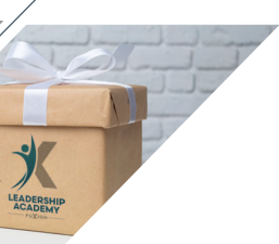
Kit de Bienvenida.*

¡Este 2025, los próximos grandes líderes se formarán en Panamá!