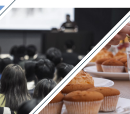
Acceso a todo el contenido y capacitaciones de la academia.*