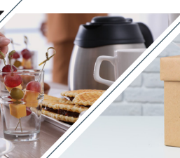
Coffee Breaks y almuerzos.*